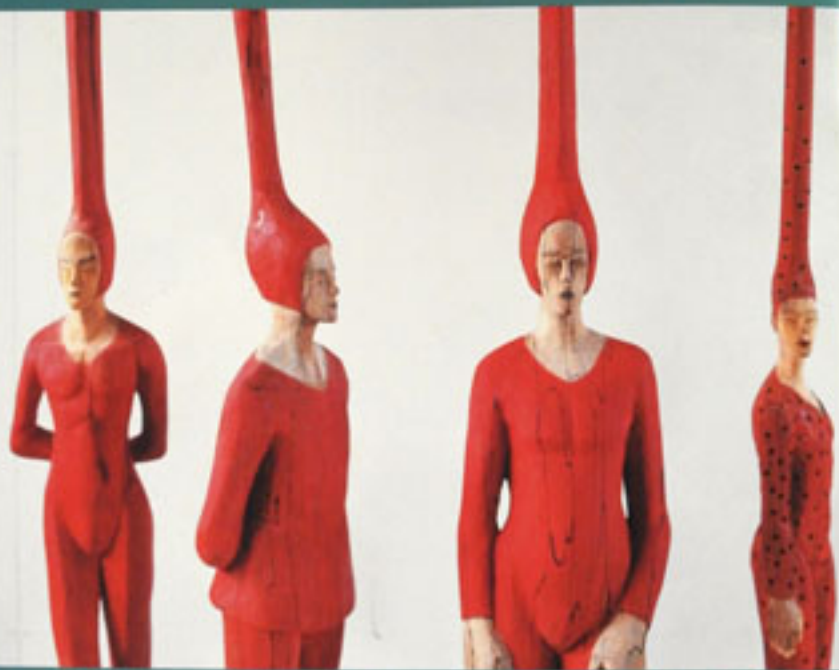
Stehende Stachelhäutiger / Standing Figures with Thorn Hats