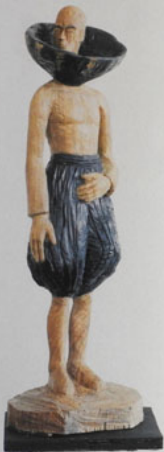
Collar Man, blau, Höhe: 90 cm, Eiche, 1993 / Collar Man, blue, Oak