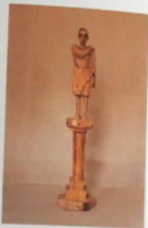
7. Ständermann Eiche, 1964 Höhe 123 cm