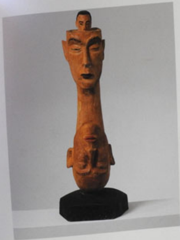
Figure 10.11. 1990 (2002), Woman with The Bowl-Head