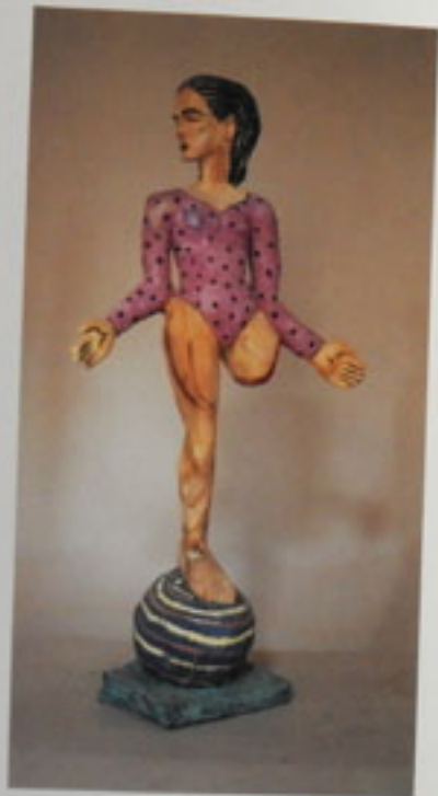
4. Der Körper-Gut Linde, 1982 Höhe 130 cm