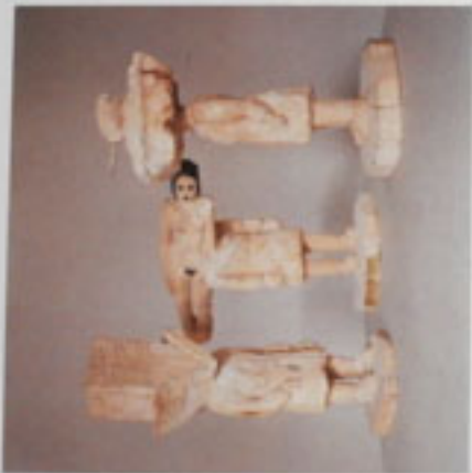
20. Mit Schakel und Pfeilen Laok, 1000 H. 43, 51 und 5 cm