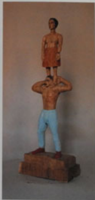
5. Trägerfigur Exner, 1994 Höhe 173 cm