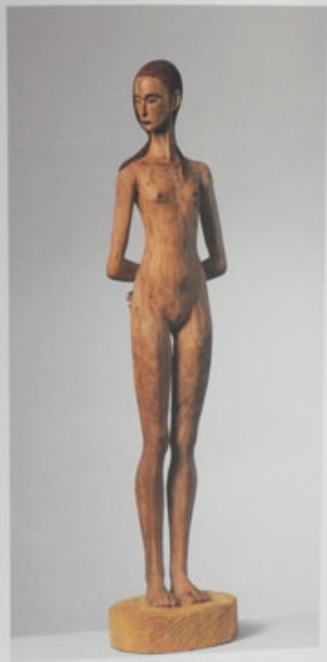
Luciano Minguzzi, 133 x 28 x 20 cm, Scarpal edition 1/3