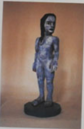
8. Kleines Mädchen mit Sandalen Papier, 1962 Höhe 126 cm