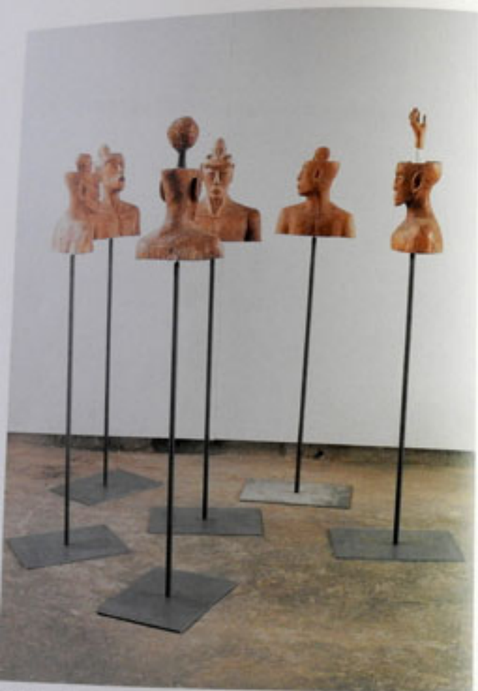
Konferenz, sechsteilige Installation, Holzbüsten auf Stahlsockel / Conference, installation of six wooden Busts on Steel Plinths