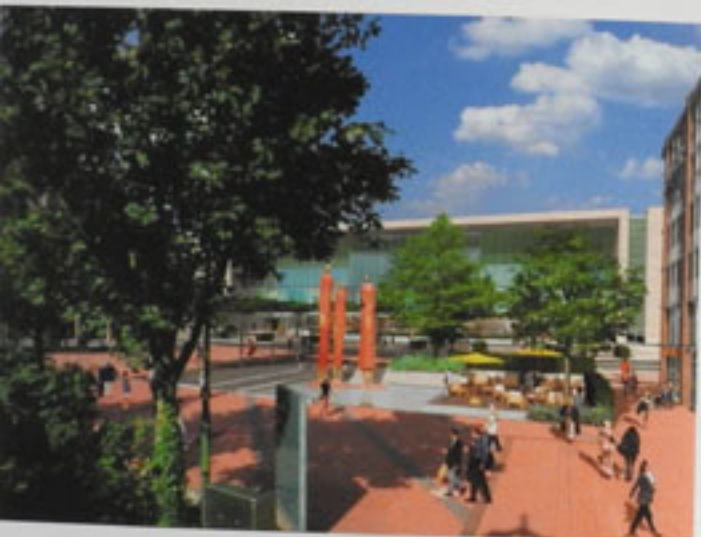
View from the A22 Plaza from the A22 Plaza, Hamburg, 2010, Jani, 100 cm, Photomontage (photo montage)