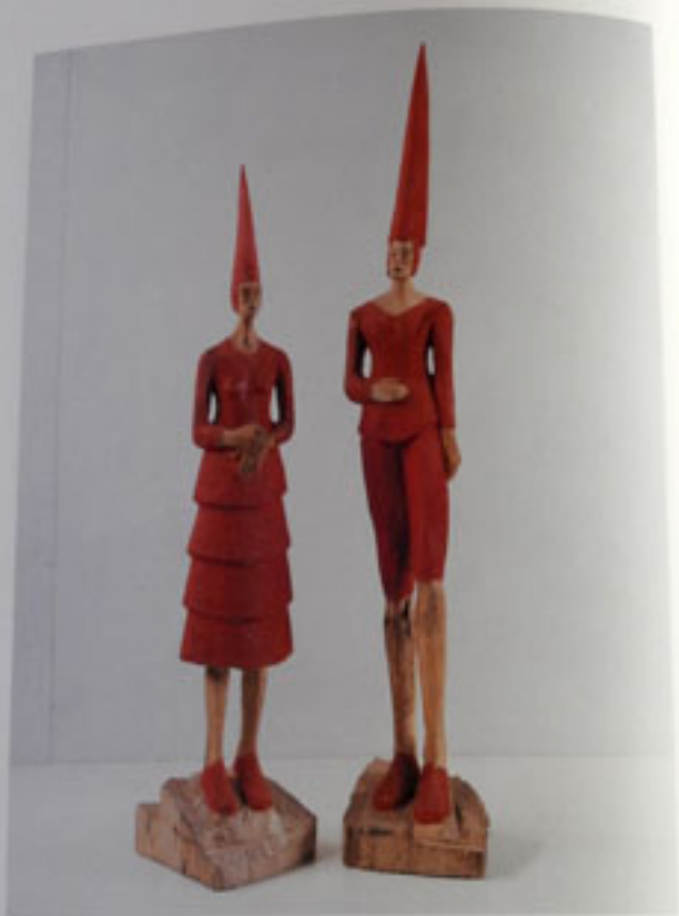
Kingsize, Höhe: 117 cm, 140 cm, Buche, 1998 / Royal Couple, Beech