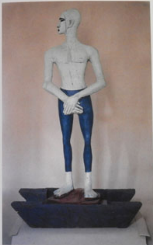
24. Großer Mann im Boot Laok, 1000 Höhe 200 cm