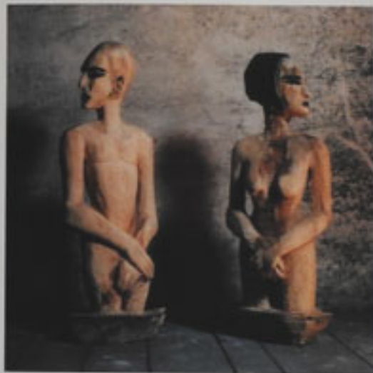
10. Schiffchenpaar II Papier, 1963 Höhe 136 und 107 cm