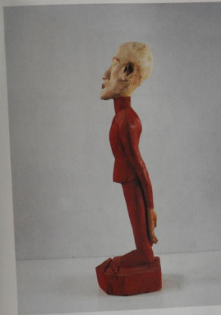
Number One, Höhe: 118 cm, Linde, 1998 / Number One, Linde