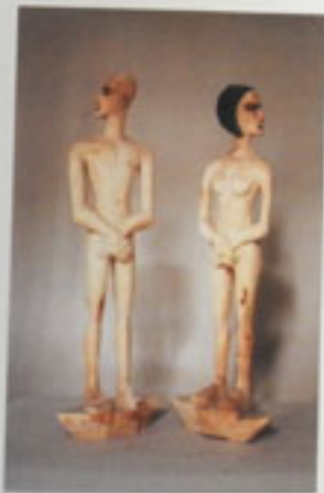
9. Schiffchenpaar I Links, 1962 Höhe 113 und 110 cm