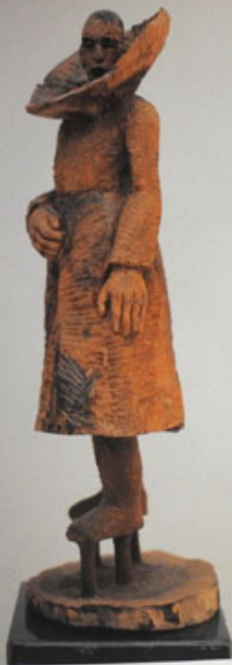
Stelzenkragenmann, Höhe: 88 cm, Walnuss, 1994 / Collar Man on Stilts, Walnut