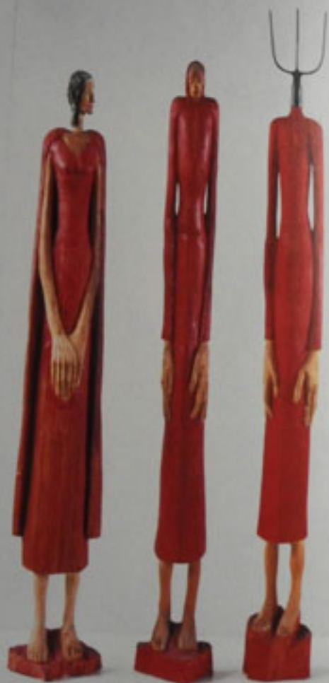
[X-tender large], Höhe: 192 cm, 194 cm, 212 cm, Linde 1996 / XTl [X-tender large], Linde