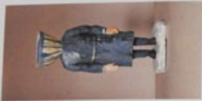
18. Angkor Laok, 1000 Höhe 48,5 cm