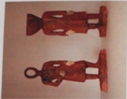
19. Laokmenschengruppe Laok, 1000 Höhe 48,5 und 50 cm