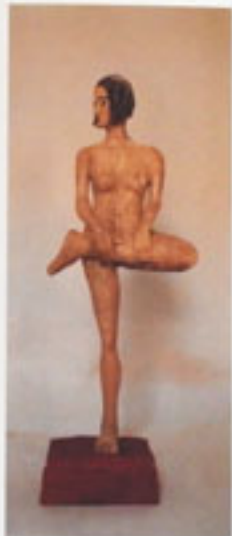
21. Balance Erika 1966 Höhe 112 cm