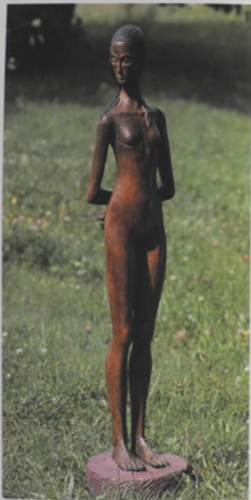
L. Basso, 133 x 28 x 20 cm, Scarpal edition 1/3