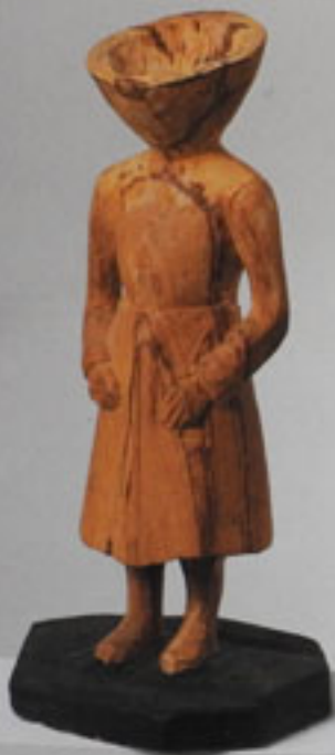
Figure 10.10. 1990 (2002), Woman with The Bowl-Head