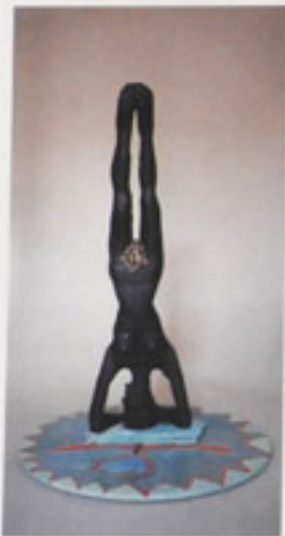
19. Körperstudien Erika 1963/64 Höhe 87 cm