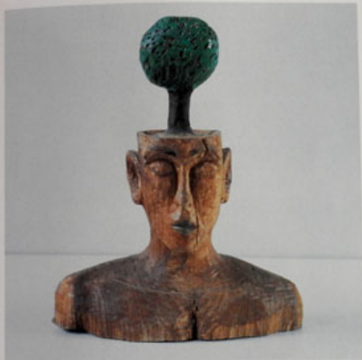
Kopfbäum A, Höhe: 49 cm, Eiche, 1996 / HeadTree, Oak