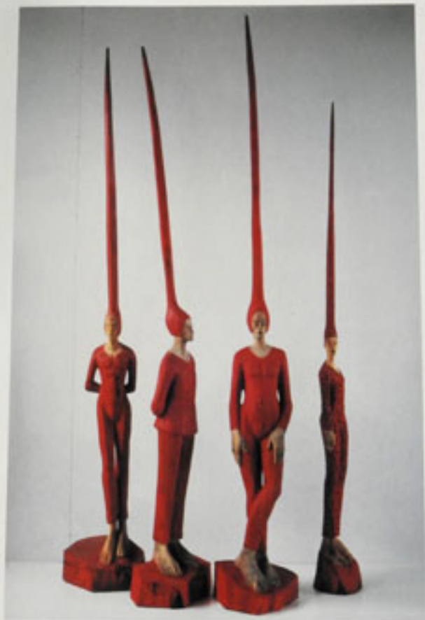
Stehende Stachelträger, Buche, 1998 und 1999 Höhe: A 211 cm, B 240 cm, C 240 cm, D 253 cm Standing Figures with Thorn Hats, Beech