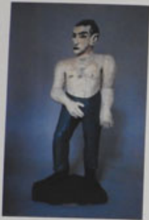
6. Nackt Querschnitt Papier, 1962 Höhe 131 cm